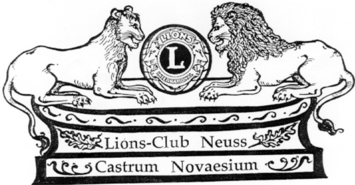
(Ursprünglich geplantes Logo des neuen Neusser Lions-Clubs)