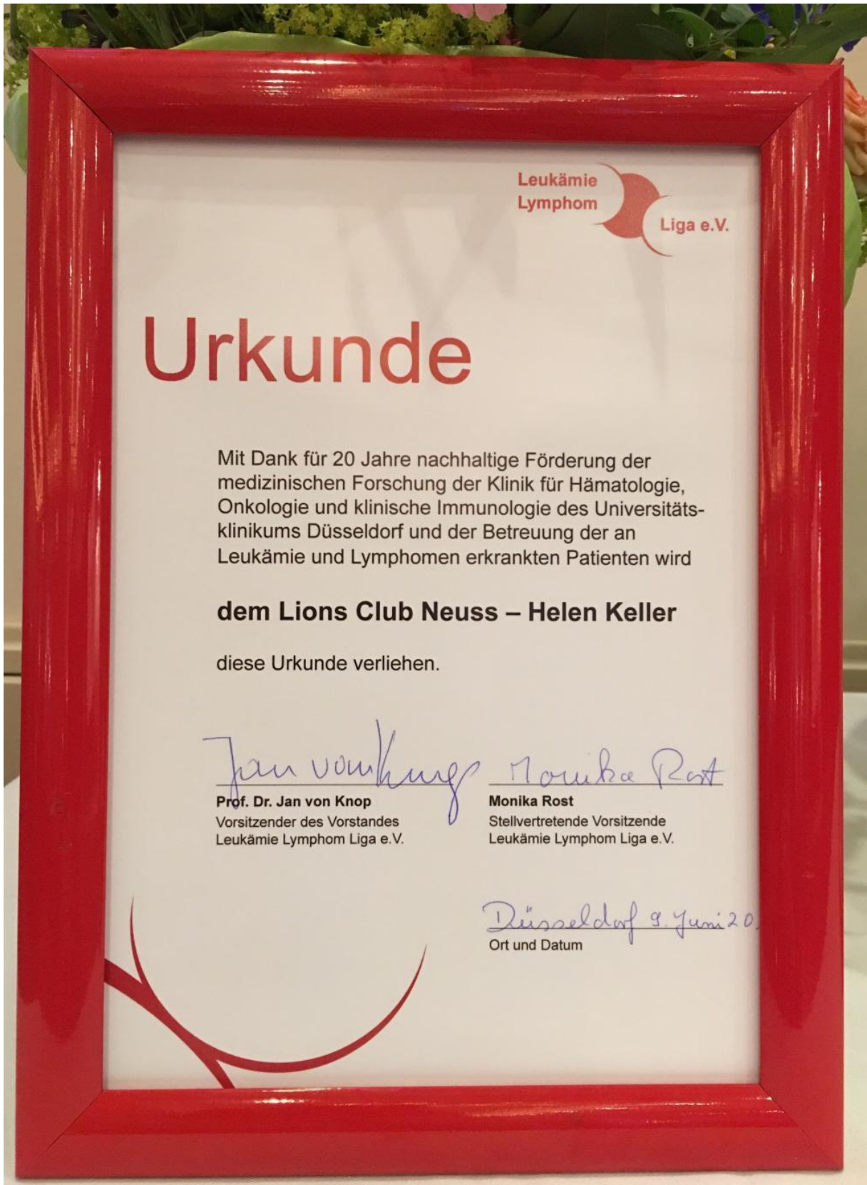
(Urkunde der Leukämie-Lymphom-Liga an den Lions Club Neuss-Helen Keller)